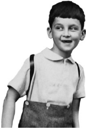
Tom Katz - Foto Offenes Archiv der Mahn- und Gedenkstätte Düsseldorf